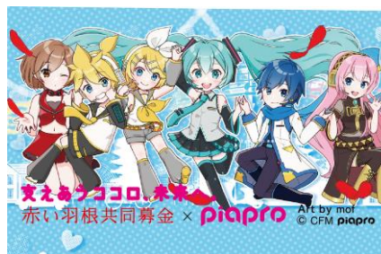
▼イラスト展開図(イラスト:mof さん)