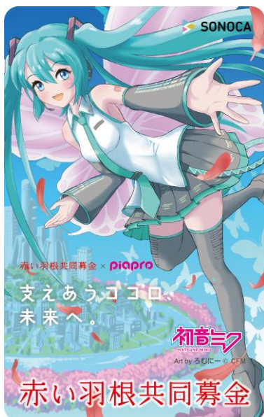
▼SONOCA(イラスト:ろむにーさん)